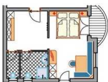
Typ Klein | 38-44m 2